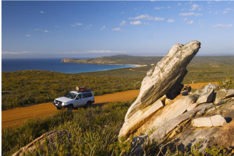
Veduta di Hamersley Drive, Cave Point e Mylies Beach, nel Fitzgerald River National Park