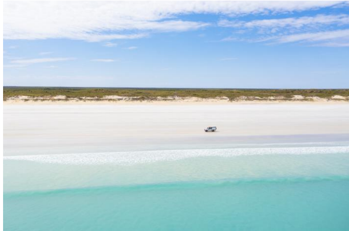
Cable Beach, Broome

Per chi preferisce rimanere all'asciutto, Cable Beach permette di poter apprezzare lunghe passeggiate sulla finissima sabbia, magari durante un magico tramonto, ma anche sentieri di diversa difficoltà all'interno del parco Minyirr Park, un'oasi ricca di vegetazione e fauna selvatica.