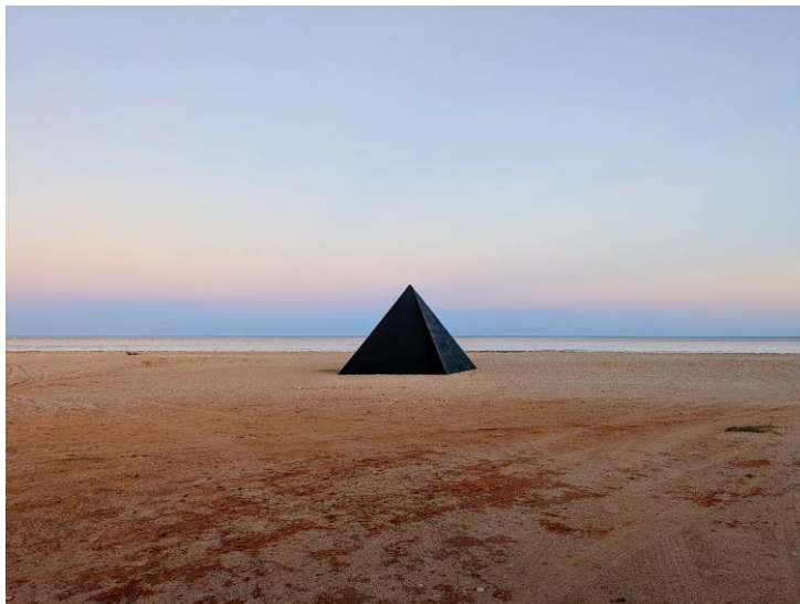
Pink Floyd, Pyramid beach shot

In questa occasione, i Pink Floyd hanno celebrato il 50° anniversario del loro album DARK SIDE OF THE MOON con un evento speciale dedicato ad otto fortunati fan, durante il quale sono state riprodotte le famose rime finali dell'album "and the sun is eclipsed by the moon" in modo da sincronizzarle con il momento esatto dell'eclissi totale - un avvenimento straordinario, nel più incredibile degli scenari.