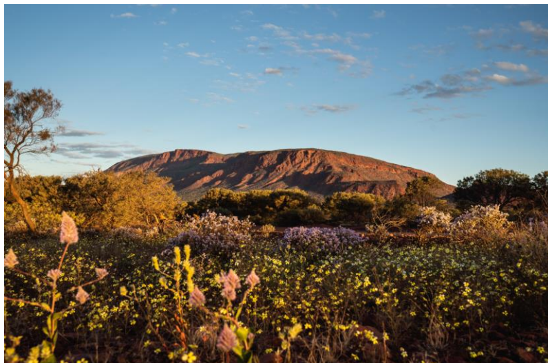
Mount Augustus National Park

Durante un viaggio in questa zona, i visitatori possono scoprire paradisi naturali in parchi nazionali remoti, antiche pitture rupestri e siti aborigeni di grandissimo interesse culturale, città fantasma, soggiorni nelle suggestive "station" immerse nella natura e distese di coloratissimi fiori selvatici.