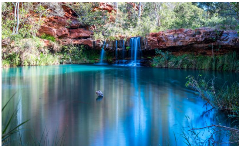
Jubura (Fern Pool), Karijini National Park

Fern Pool si trova nella parte orientale del Karijini National Park e offre non solo l'opportunità di un rinfrescante bagno, ma anche la possibilità di godersi un tranquillo picnic nelle sue vicinanze. Per coloro che desiderano prolungare l'avventura, un sentiero di quattro chilometri (due ore di cammino andata e ritorno) conduce gli escursionisti alla Circular Pool. Quest'ultima, incastonata in un giardino segreto, regala una vista mozzafiato con le sue acque cristalline, creando un panorama straordinario. Il contrasto tra il colore degli eucalipti e le famose scogliere rosse terrazzate, levigate dal tempo, rende questo scenario uno spot imperdibile.