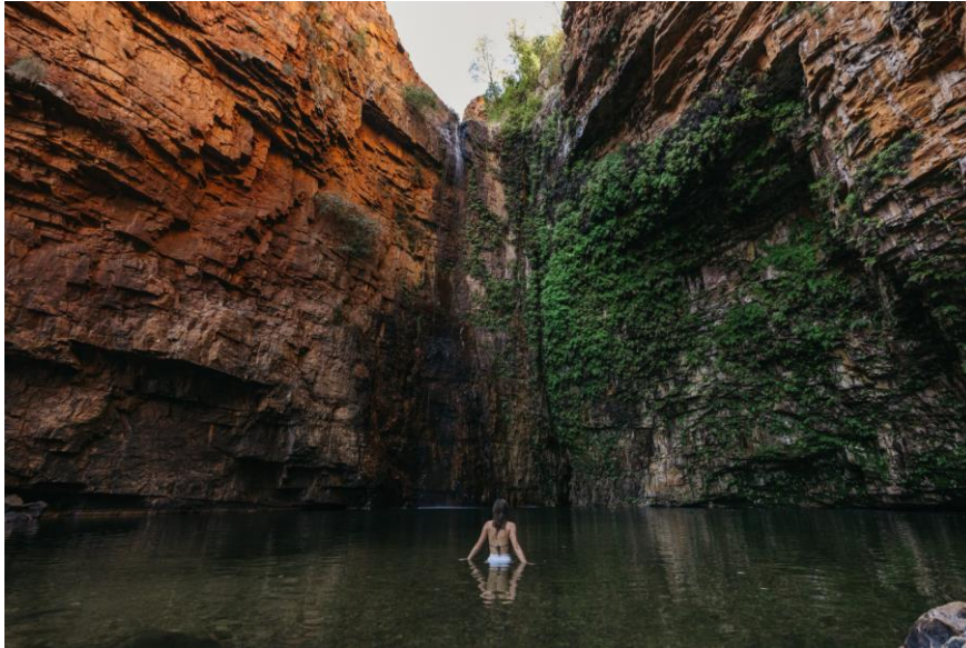
Emma Gorge, El Questro Wilderness Park

suggestiva passeggiata attraverso una fitta foresta di palme, si raggiunge la piscina naturale: una vera e propria oasi. Da notare che queste due località (Emma Gorge e le Zebedee Springs) sono accessibili solo durante le ore mattutine.