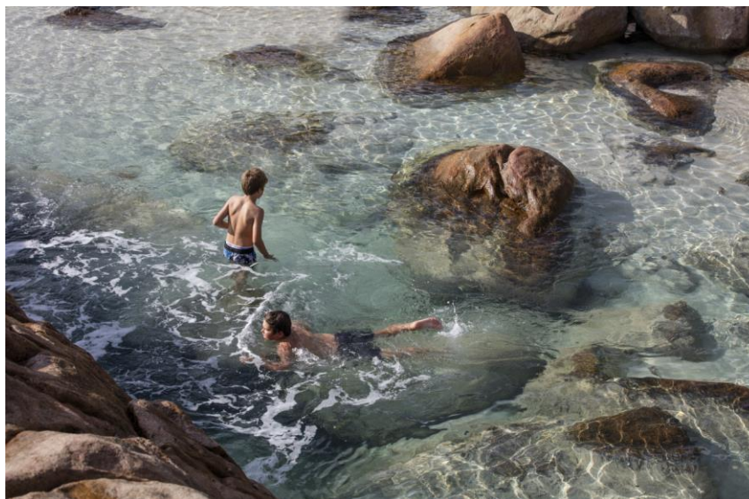
Indjidup Beach, nei pressi di Yallingup

Se si decide di organizzare un viaggio nella regione di Margaret River, non ci si può perdere questo vero e proprio tesoro nascosto, sulla spiaggia di Indjidup. Si tratta di Wyadup Rocks, una piscina naturale creata tra le rocce, che sorge grazie a una cascata che, tuffandosi verso la spiaggia, crea questa piscina cristallina. Nella parte settentrionale della spiaggia di Indjidup, le rocce a monte proteggono la piccola baia dalle enormi onde dell'Oceano Indiano. Nei giorni di forte marea, l'acqua viene spinta attraverso una fessura tra le rocce ricreando l'effetto "idromassaggio", che garantisce ai visitatori una vera e propria esperienza da Spa. A cosa serve un centro benessere quando si può ricevere un trattamento del genere in una vasca idromassaggio naturale?