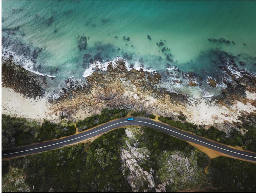
Eagle Bay Beach, Dunsborough