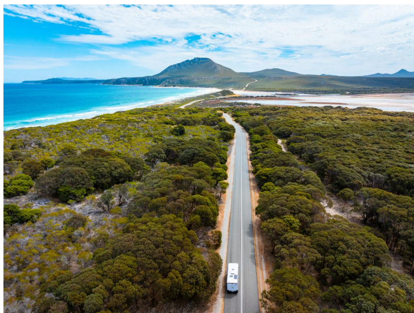
Fitzgerald River National Park

Per i viaggiatori italiani, il viaggio diventa ancora più semplice: Qantas conferma anche nel 2026 il volo diretto stagionale da Roma , operativo da maggio a ottobre , trasformando il viaggio in uno spostamento semplice e senza interruzioni. In alternativa, lo scalo a Singapore, Dubai o altri grandi hub asiatici trasforma il viaggio in un arco continuo, aprendo la porta a un'esperienza che ripaga ogni chilometro percorso.