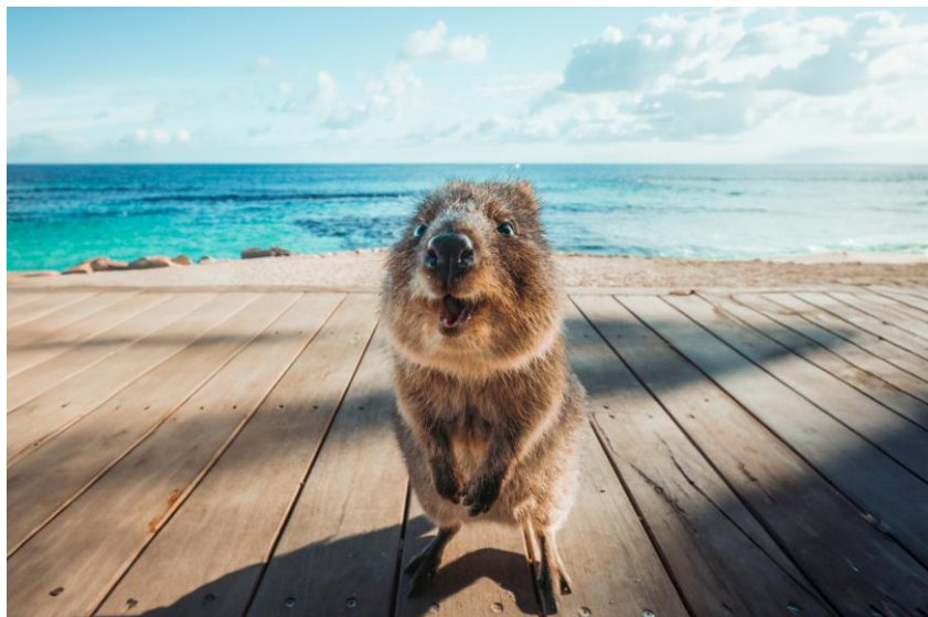
Quokka, Rottneest Island

Il Western Australia offre incontri con la fauna che sorprendono e incantano. Rottneest Island è la casa dei quokka , definiti gli animali più felici della Terra, mentre Monkey Mia permette di osservare da vicino i delfini selvatici , che si avvicinano curiosi, quasi a voler salutare i visitatori. A Shark Bay nuotano i rari dugonghi , e lungo la Ningaloo Coast si può incontrare il gigante gentile degli oceani, lo squalo balena . Durante la stagione migratoria, poi, megattere e orche animano la costa e il mare aperto con avvistamenti indimenticabili. Ad Hamelin Bay enormi razze sfiorano la riva, e ovunque, dai prati alle spiagge di sabbia bianca come Lucky Bay, i canguri incarnano l'essenza selvaggia ma accogliente di questo territorio. La natura qui è selvaggia, sì, ma piena di meraviglia.