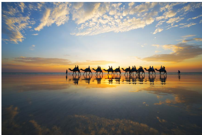
Cammelli al tramonto a Cable Beach, Broome

all'anno, sprigiona un'energia unica, ideale per vivere all'aperto e godere delle stagioni in tutte le loro sfumature. Ogni regione racconta la propria storia climatica, rendendo il WA una destinazione flessibile, pronta ad accogliere i viaggiatori in ogni periodo dell'anno. E ad ogni stagione corrisponde uno spettacolare calendario naturale con migrazioni della fauna selvatica, fioriture coloratissime e prelibatezze gastronomiche, oltre a un calendario di eventi che celebra le peculiarità uniche di questo straordinario territorio.