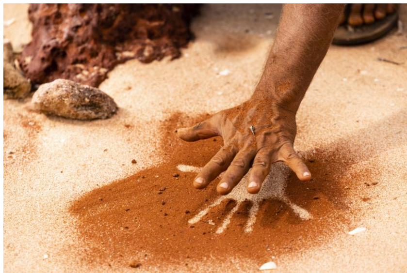
Wula Gura Nyinda Eco Cultural Adventures

Uno dei fraintendimenti più diffusi è ritenere il Western Australia un territorio “giovane”, legando la sua storia alla sola scoperta da parte degli esploratori europei. Al contrario, qui si trova una delle culture viventi più antiche del pianeta: quella dei popoli aborigeni, che custodiscono storie, tradizioni e connessioni millenarie con il territorio. Oltre ai siti UNESCO, dal Bungle Bungle Range a Shark Bay, l'intero Stato si presenta come un mosaico di eredità culturale, storia, arte e spiritualità, dove ogni angolo racconta la profondità di un passato che continua a vivere nel presente.